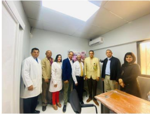
Autoridades del Hospital y del Patronato Presidente Estrella Ureña

Comunicaciones - 18 marzo, 2023 - Noticias - Sin comentarios