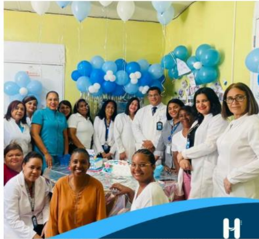
Bioanalistas, colaboradores y personal administrativo del HRPEU

Comunicaciones - 9 mayo, 2023 - Noticias - Sin comentarios